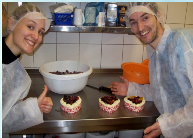
Foto: acțiune comercială la o patiserie în Germania: cei căsătoriți au copt tortulețe în formă de inimă și au stat la o cafea

Firme, companii – promoții pentru cupluri căsătorite, oferte speciale în magazine sau restaurante etc.